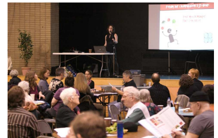
Forum sur l'alimentation à St-Henri le 24 février 2010

Des outils de communication avec la population sont également nécessaires pour faire connaître les actions, positions et réalisations de Solidarité St-Henri. C'est pourquoi la table s'est dotée d'un nouveau site Internet. Cependant, les changements au niveau de l'équipe de travail, en plus d'un certain nombre de difficultés techniques, n'ont pas permis de mener à terme en 2009-2010 le lancement de cet outil. Ce n'est toutefois que partie remise pour 2010-2011.