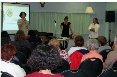
Un des « rendez-vous citoyen » de Mobilisation-Turcot

Bien que l'action de Solidarité St-Henri soit par nature locale, il n'empêche que la lutte à la pauvreté nécessite également des interventions globales , auprès d'instances plus larges que celles d'un quartier, ou en appui à des mouvements sociaux organisés, en gardant à l'esprit les besoins présents dans le quartier de St-Henri. En 2009-